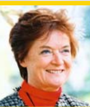
Anne-Marie Sigmund, Présidente, Comité européen économique et social ( www.ces.eu.int )

« A l'image d'un pont entre l'Europe et la société civile, le Comité européen économique et social appuie fortement les efforts de l'Union européenne pour une société et un monde du travail libre de toute discrimination et favorisant la diversité. Il est donc bien placé pour aider à promouvoir un tel dialogue. Je suis sincèrement convaincue que tous les habitants de l'Union doivent bénéficier d'un niveau minimum de protection et du droit de riposte légal contre les discriminations. Cela renforcera également la cohésion économique et sociale au sein de l'Union. J'ai confiance en l'idée qu'un meilleur dialogue, fondé sur les bonnes pratiques, entre le monde des affaires, les syndicats et les autres acteurs économiques et sociaux, démontrera que l'égalité de traitement dans le domaine de l'emploi peut améliorer la performance économique et l'intégration sociale. »