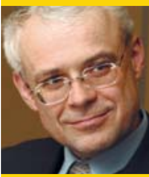
Vladimir Špidla, Commissaire européen pour l'emploi, les affaires sociales et l'égalité des chances