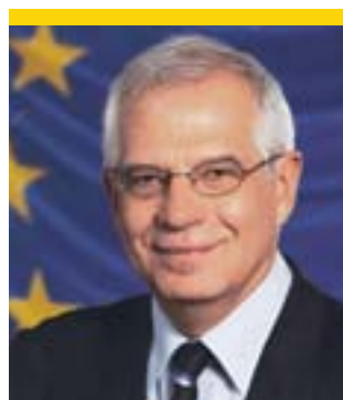
Josep Borrell Fontelles, MEP, Président du Parlement européen ( www.europarl.eu.int )

« Le respect pour la diversité est fondamental pour l'Union européenne. Cependant, l'Europe n'est pas exempte d'intolérance et de discrimination. Les institutions européennes condamnent toute espèce de discrimination et travaillent ensemble pour prévenir la discrimination dans le cadre de l'article 13 du Traité de la Communauté Européenne et la Charte des droits fondamentaux. Le Parlement européen, en tant qu'institution représentant tous les citoyens de l'Union, est fortement engagé dans la lutte contre la discrimination et le racisme. Il continuera à exiger l'existence d'une législation appropriée contre le racisme et la xénophobie au niveau européen. »