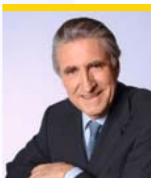
Ernest-Antoine Seillière, Président de l' UNICE (Union of Industrial and Employers' Confederations of Europe – www.unice.org )

« L'UNICE est fermement engagée dans la promotion de l'égalité et de la diversité dans le domaine de l'emploi. Une entreprise est gagnante lorsque les employés sont recrutés, formés, et promus sur la base de leurs compétences et sans référence à leur sexe, leur âge, leur race, leur handicap, leur orientation sexuelle ou leur religion. Un nombre croissant d'entreprises mènent avec succès des politiques de diversité, qui font partie des moyens d'obtenir des unités de travail performantes. L'UNICE combat pour la prolifération de ces bonnes méthodes de travail, et encourage les entreprises et les employés à agir. En Mars 2005, par exemple, elle a adopté avec les syndicats européens un protocole d'actions sur l'égalité des sexes qui souligne les priorités d'action dans les années à venir. »