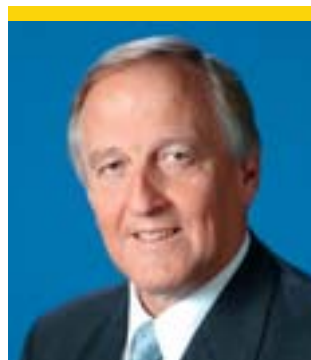
Peter Straub, Président du Comité des Régions ( www.cor.eu.int )

« Le Comité des Régions refuse toute forme de discrimination et croit fermement que la lutte contre la discrimination est une question de changement d'attitudes et de valeurs. Le refus de toute forme de discrimination est une condition essentielle pour l'Union européenne pour développer un espace de liberté, de sécurité et de justice. De ce point de vue, les autorités locales et régionales ont un rôle important à jouer puisqu'elles opèrent à la base et sont proches des citoyens, augmentant la connaissance et la compréhension des discriminations diverses. Le Comité des Régions a de ce fait appelé les autorités locales et régionales et d'autres fournisseurs d'informations à s'engager totalement dans le Programme d'Action, parce qu'ils sont les mieux placés pour faire connaître les mesures prises pour lutter contre les discriminations. »